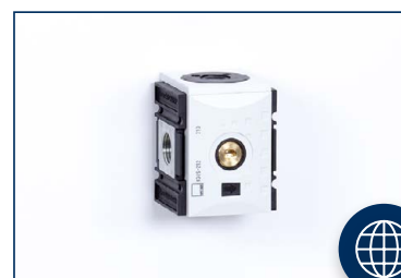
ROZDEĽOVAČE A SPÄTNÉ VENTILY