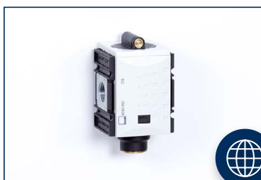
ZAPÍNACIE A POMALONÁBEHOVÉ VENTILY