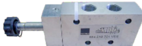
INOX ventil po 720 hodinách v komore so solným rozprašovaním

Vo všeobecnosti možno konštatovať, že ak sú vplyvy prostredia zaťažujúce, agresívne a korózne, treba si zvoliť odolnejší materiál, ktorý je bežne označený ako 316 alebo 321..