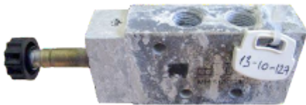
Hliníkový ventil po 720 hodinách v komore so solným rozprašovaním